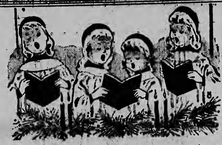
Den nan inocencia... nan pensamentu ta bal tambe na e regalanan, cu nan lo haya!

Seucha nos radio-transmisionan, tur diadomingo. Via Radio-Kelboom di 7 - 7.30 Tur Diabues Via Voz di Aruba, di 6.30 - 7 (Esaki ta un publicacion di ELMAR)